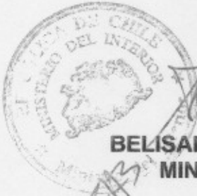
Belasco BELISARIO VELASCO BARAONA MINISTRO DEL INTERIOR

Lo que transcribo a Ud. para su conocimiento Saluda atte. a Ud.