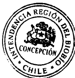
GLORIA BRIONES NEIRA CONTRALORA REGIONAL DEL BIOBÍO