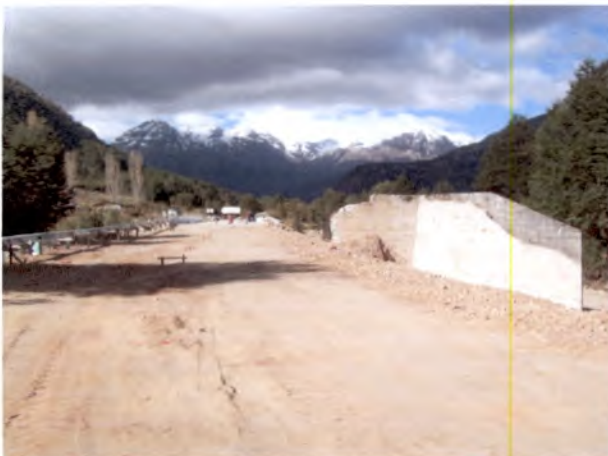
Foto 11: Puente El Salto Falta retirar estribos del puente antiguo