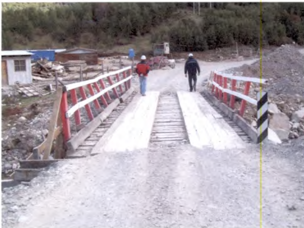
Foto 15: Puente El Correa Falta direccional en acceso puente provisorio