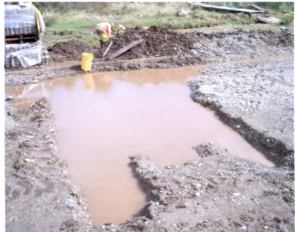
Foto 2: Aeródromo de Ayacara Apozamiento de agua en la subrasante