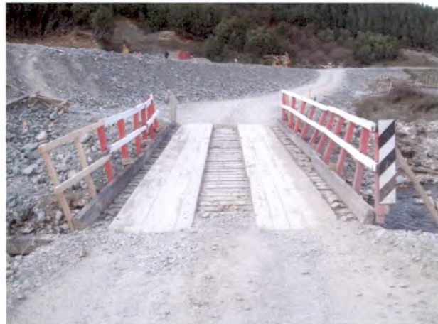
Foto 16: Puente El Correa Falta direccional en acceso puente provisorio