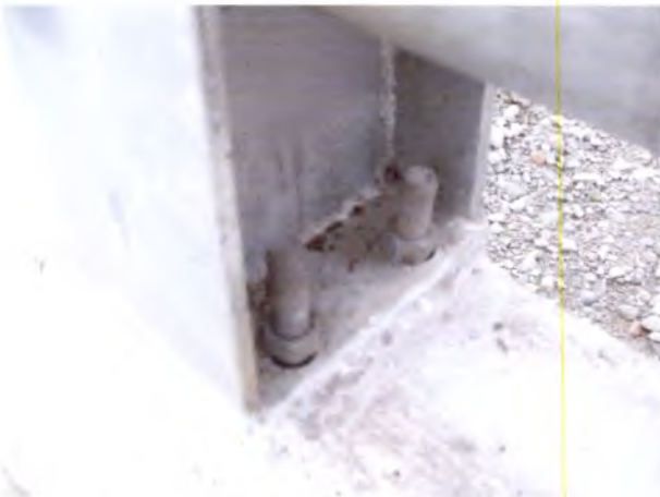
Foto 5: Puente La Corrida Faltan pinchazos de soldadura en tuercas