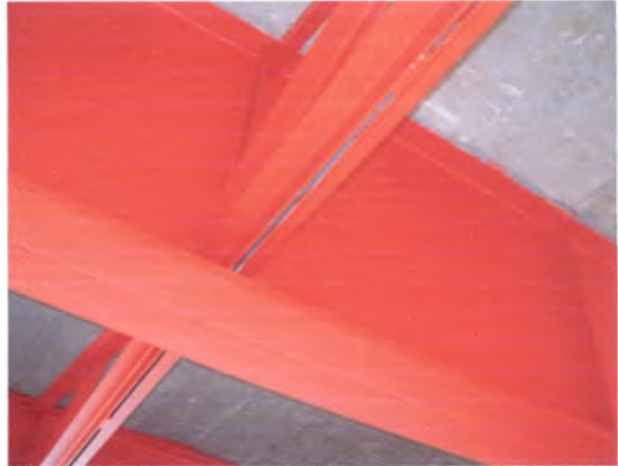
Foto 8: Puente La Subida Incompleta pintura de estructura metálica