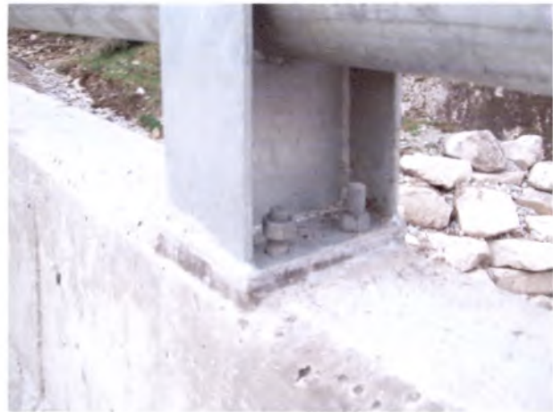
Foto 10: Puente La Subida Faltan pinchazos de soldadura en tuercas