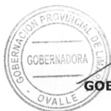
SUSANA VERDUGO BARAONA GOBERNADORA PROVINCIAL DE LIMARÍ REGIÓN DE COQUIMBO