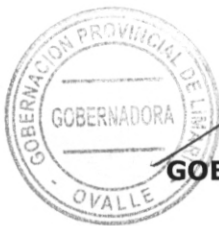
SUSANA VERDUGO BARAONA GOBERNADORA PROVINCIAL DE LIMARÍ REGIÓN DE COQUIMBO