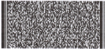
Timbre Electrónico SII

Res.99 de 2014 Verifique documento: www.sii.cl