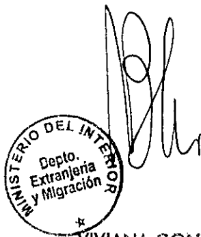
VIVIANA GONZALEZ LOPEZ SECCION VISAS

CDH/PVS/CPF [308]07/06/2010 Distribución: 1.- Policía Internacional 2.- Archivo