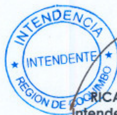
RICARDO CIFUENTES LILLO* Intendente Región de Coquimbo