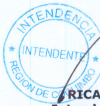
RICARDO CIFUENTES LILLO Intendente Región de Coquimbo