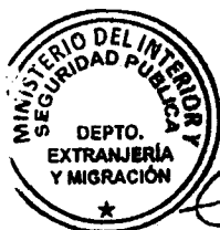
KATIUSKÁ LORCA SILVA Sección Visas

ABA/NVT/VGL/KLS/MAB [308]07/11/2019 Distribución: 1.- Policía Internacional 2.- Archivo