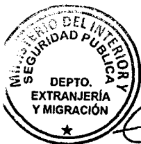
KATIUSKA LORCA SILVA Sección Visas

ABA/NVT/VGL/KLS/MAB [322]04/11/2019 Distribución: 1.- Policía Internacional 2.- Archivo