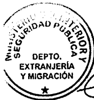
KATIUSKA LORCA SILVA Sección Visas

ABA/NVT/VGL/KLS [312]24/10/2019 Distribución: - Investigaciones - Depto. Extranjería M.I.