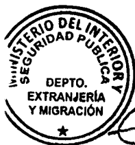
KATIUSKA LORCA SILVA Sección Visas

ABA/NVT/VGL/KLS/MAB [322]04/10/2019 Distribución: 1.- Policía Internacional 2.- Archivo