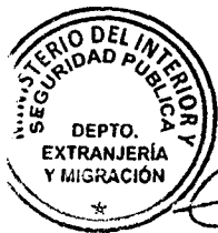
KATIUSKA LORCA SILVA Sección Visas

ABA/NVT/VGL/KLS/MAB [322]23/09/2019 Distribución: 1.- Policía Internacional 2.- Archivo