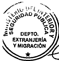
KATIUSKA LORCA SILVA Sección Visas

ABA/NVT/VGL/KLS/APM [322]08/05/2019 Distribución: 1.- Policía Internacional 2.- Archivo