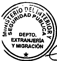
KATIUSKA LORCA SILVA Sección Visas

ABA/NVT/VGL/MAB [308]18/04/2019 Distribución: 1.- Policía Internacional 2.- Archivo