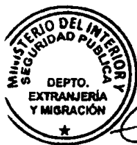
KATIUSKA LORCA SILVA Sección Visas

ABA/NVT/VGL/KLS [312]01/04/2019 Distribución: - Investigaciones - Depto. Extranjería M.I.