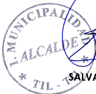
SALVADOR DELGADILLO BASCUÑAN ALCALDE I. MUNICIPALIDAD DE TIL TIL