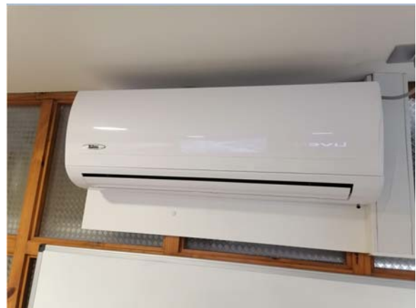
Sala de Reuniones