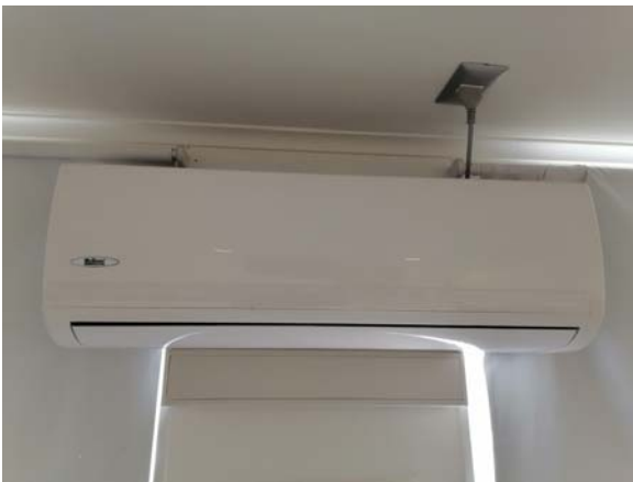
Sala Monitoreo (lado derecho)