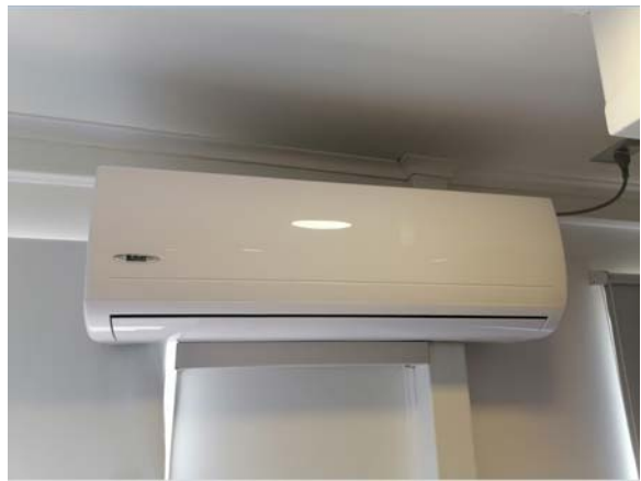
Sala Monitoreo (lado izquierdo)