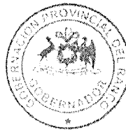
Alonso Edgardo Perez de Arce Carrasco Gobernador Provincial del Ranco

Para verificar documento ingresar en la siguiente url https://validadoc.interior.gob.cl/