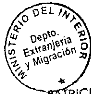
PATRICIA VÁSQUEZ SEPULVEDA SECCIÓN VISAS

CDH/PVS/klS [308]01/07/2011 Distribución: 1.- Policía Internacional 2.- Archivo