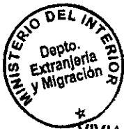
VIVIANA GONZALEZ LOPEZ SECCION VISAS

CDH/PVS/cepf [323] 02/03/2011 Distribución: 1.- Policía Internacional 2.- Archivo