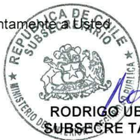
RODRIGO UBILLA MACKENNEY SUBSECRETARIO DEL INTERIOR