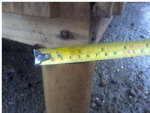
PILOTE DE 2,5" DE DIAMETRO