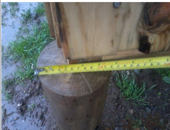
PILOTE DE 4,5" DE DIAMETRO S