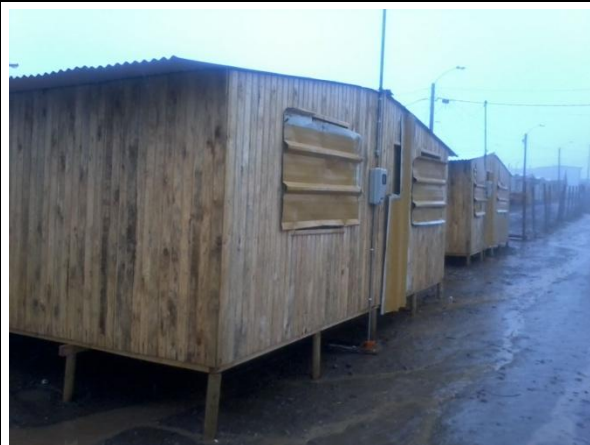
SOLUCIONES IMPLEMENTADAS, SIN ENTREGAR