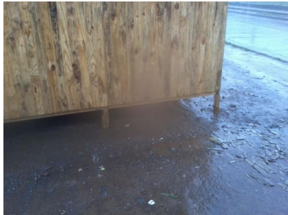
SOLUCIONES IMPLEMENTADAS, SIN ENTREGAR