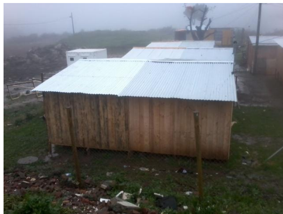
SOLUCION COMPUESTA POR 2 UNIDADES, ENTREGADA A USUARIOS FINALES