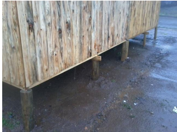
SOLUCION COMPUESTA POR 2 UNIDADES, ENTREGADA A USUARIOS FINALES