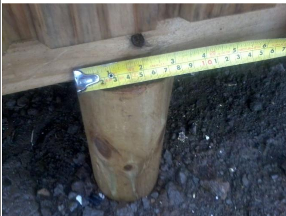
PILOTE DE 3" DE DIAMETRO