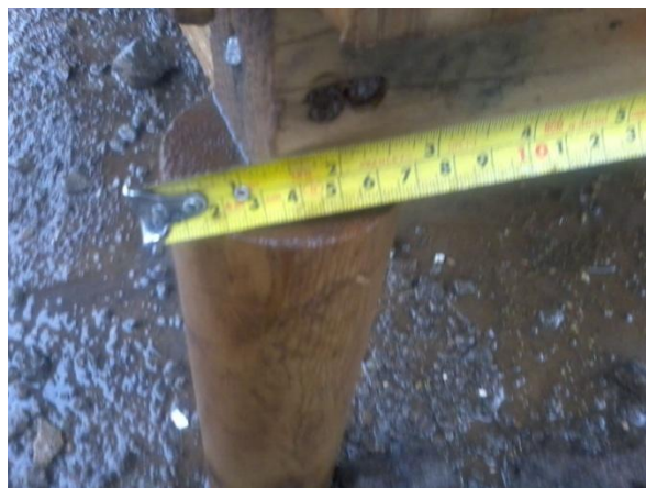
PILOTE DE 2,5" DE DIAMETRO