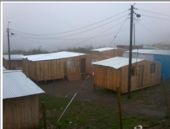
SOLUCION COMPUESTA POR 3 UNIDADES, ENTREGADA A USUARIOS FINALES