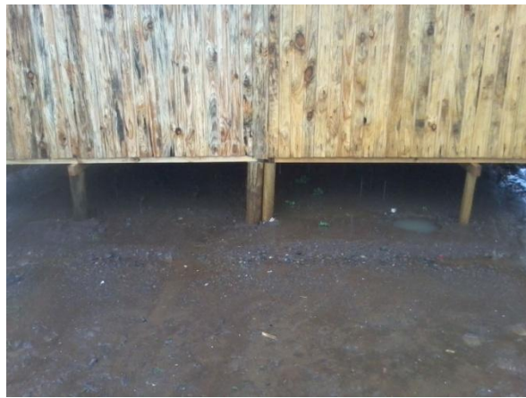
SOLUCION COMPUESTA POR 3 UNIDADES, ENTREGADA A USUARIOS FINALES