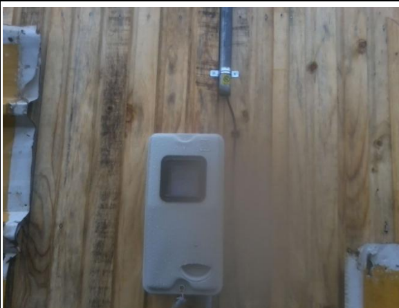
PROVISION DE SERVICIOS BÁSICOS