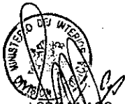
RODRIGO PEÑAILILLO BRICEÑO Ministro del Interior y Seguridad Pública