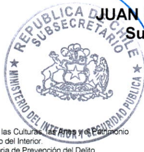
JUAN FRANCISCO GALLI BASILI Subsecretario del Interior

DISTRIBUCION: - Gabinete de la Ministra de las Culturas, las Artes y el Patrimonio - Gabinete del Subsecretario del Interior. - Gabinete de la Subsecretaria de Prevención del Delito - Estado Mayor Conjunto.