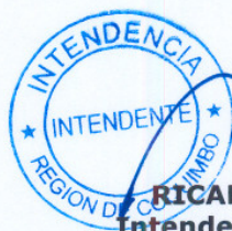
RICARDO CIFUENTES LILLO Intendente Región de Coquimbo