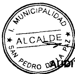
AUDITO RETAMAL LAZO ALCALDE MUNICIPALIDAD DE SAN PEDRO DE LA PAZ