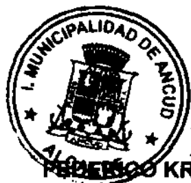
FEDERICO KRÜGER FINSTERBUCH ALCALDE MUNICIPALIDAD DE ANCUD