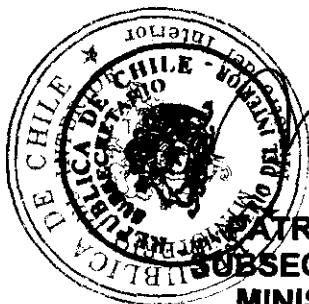
PATRICIO ROSENDE LYNCH SUBSECRETARIO DEL INTERIOR MINISTERIO DEL INTERIOR

El presente instrumento se suscribe en 2 (dos) ejemplares de igual tenor y contenido, quedando uno en poder de cada una de las partes.