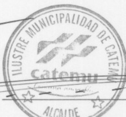
BORIS LUKSIC NIETO ALCALDE I. MUNICIPALIDAD DE CATEMU