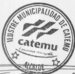
BORIS LUKSIC NIETO ALCALDE I. MUNICIPALIDAD DE CATEMU