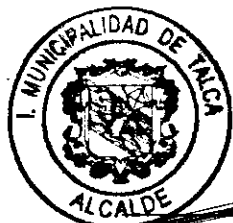
JUAN ENRIQUE CASTRO PRIETO ALCALDE I. MUNICIPALIDAD DE TALCA

Probidad: Presentar una conducta funcionaria intachable basada en la honestidad y lealtad en el ejercicio del cargo, orientando las propias acciones al cumplimiento de los objetivos de la institución, a la mejor prestación de servicios y realizando las funciones con dedicación y eficiencia. Asimismo existe una preeminencia del interés general por sobre el individual.