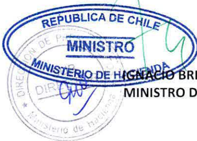
IGNACIO BRIONES ROJAS MINISTRO DE HACIENDA