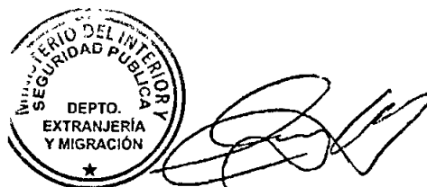
KATIUSKÁ LORCA SILVA Sección Visas

GL/KLS/ASS 4/2020 ción: cía Internacional ivo