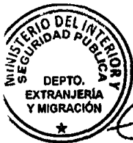
KATIUSKA LORCA SILVA Sección Visas

GL/KLS 3/2020 ción: cía Internacional ivo