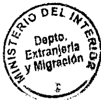
PATRICIA VASQUEZ SEPULVEDA SECCION VISAS

CDH/PVS/TA [323] 22/12/2010 Distribución: 1.- Policía Internacional 2.- Archivo