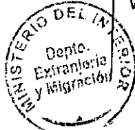
PATRICIA VASQUEZ SEPULVEDA SECCION VISAS

CGDH/PVS/MAS [308]21/12/2010 Distribución: 1.- Policía Internacional 2.- Archivo