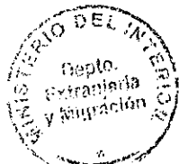
PATRICIA VASQUEZ SEPULVEDA SECCION VISAS

CDH/PVS/MAB [323] 17/12/2010 Distribución: 1.- Policía Internacional 2.- Archivo