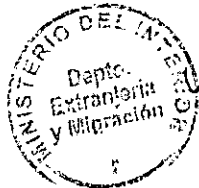
PATRICIA VASQUEZ SEPULVEDA SECCION VISAS

CDH/PVS/bm [323] 06/12/2010 Distribución: 1.- Policía Internacional 2.- Archivo