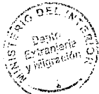
PATRICIA VASQUEZ SEPULVEDA SECCION VISAS

CGDH/PVS/MAS [323] 03/12/2010 Distribución: 1.- Policía Internacional 2.- Archivo