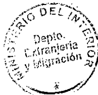
PATRICIA VASQUEZ SEPULVEDA SECCION VISAS

CDH/PVS/MAB [323] 25/11/2010 Distribución: 1.- Policía Internacional 2.- Archivo