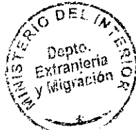
PATRICIA VASQUEZ SEPULVEDA SECCION VISAS

CDH/PVS/MAB [323] 19/11/2010 Distribución: 1.- Policía Internacional 2.- Archivo