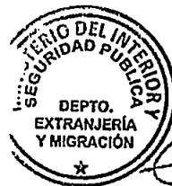
KATIUSKA LORCA SILVA Sección Visas

Distribución: 1.- Policía Internacional 2.- Archivo