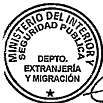
KATIUSKA LORCA SILVA Sección Visas

RSD/PVS/VGL/dzc [322]24/08/2016 Distribución: 1.- Policía Internacional 2.- Archivo