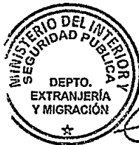
KATIUSKÁ LORCA SILVA Sección Visas

RSD/PVS/VGL/MTA [308]23/08/2016 Distribución: 1.- Policía Internacional 2.- Archivo