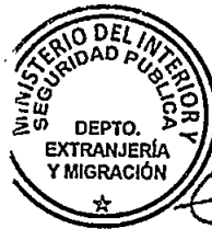
KATIUSKA LORCA SILVA Sección Visas

Distribución: 1.- Policía Internacional 2.- Archivo