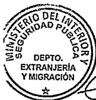
KATIUSKA LORCA SILVA Sección Visas

Distribución: 1.- Policía Internacional 2.- Archivo