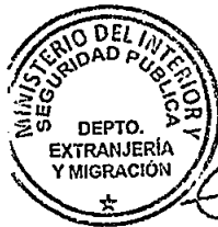
KATIUSKA LORCA SILV Sección Visas

RSD/PVS/VGL/LIR [721]17/08/2016 Distribución: 1.- Policía Internacional 2.- Archivo