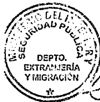
KATUSKA LORCA SILVA Sección Visas

RSD/PVS/VGL/dzc [322]07/06/2016 Distribución: 1.- Policía Internacional 2.- Archivo