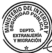
KATIUSKA LORCA SILVA Sección Visas

RSD/PVS/VGL/dzc [322]24/05/2016 Distribución: 1.- Policía Internacional 2.- Archivo